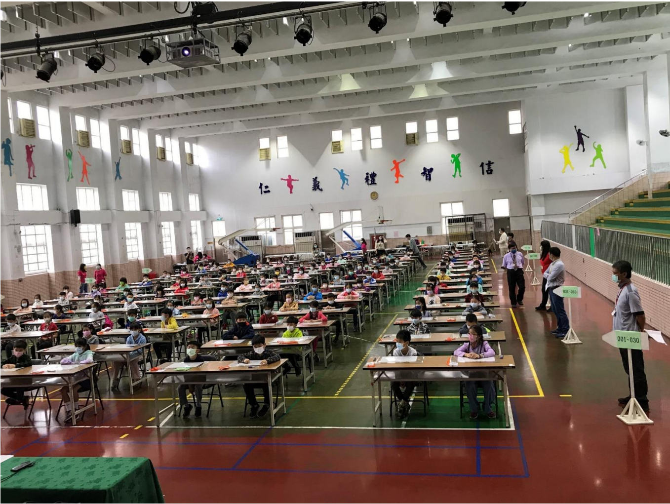
立牌與工作人員導引